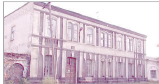
Здание медресе в настоящий момент

Сервис организован РДУМ Челябинской области