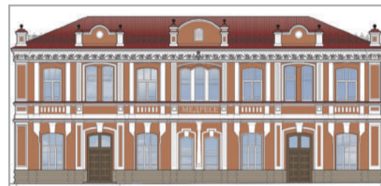
Проект-реставрация медресе в г. Троицке

Еженедельная телепередача об Исламе Регионального Духовного управления мусульман Челябинской области