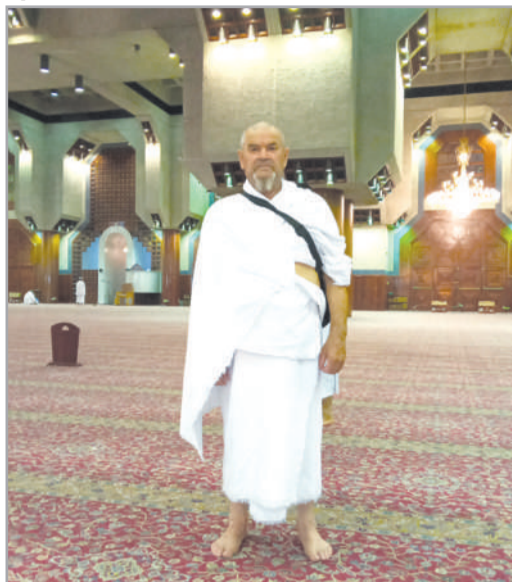
Мне впервые посчастливилось совершить хадж. Руководителем нашей группы был имам-хатыб

В этом году начало паломничества мусульман к святым местам, которое, согласно вероучению Ислама, обещает верующим прощение всех грехов и вечное блаженство после смерти, выпало на 10 августа. Согласно Исламу, каждый мусульманин хотя бы раз в жизни должен совершить это паломничество.