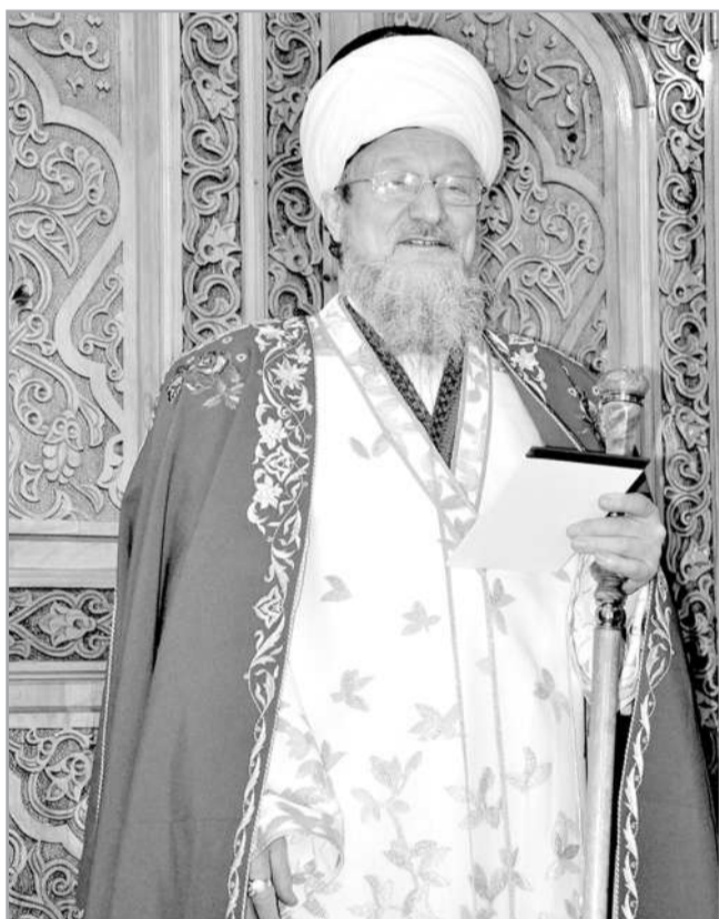
Ахыры. Башы 3-нче номерда 2020

22 – нче ВӘГАЗ Әсмаул-Хуснә (Исми Әгзәм) АЛЛАҢНЫҢ ӘЛ-БАСЫТ ДИГӘН ИСЕМЕ