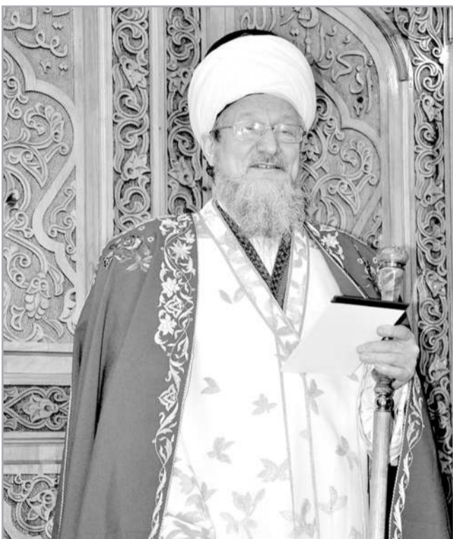
Ахыры. Башы 3-7-нче номерда 2020

22 – нче ВӘГАЗ Әсмаул-Хуснә (Исми Әгзәм) АЛЛАҢНЫҢ ӘЛ-БАСЫТ ДИГӘН ИСЕМЕ