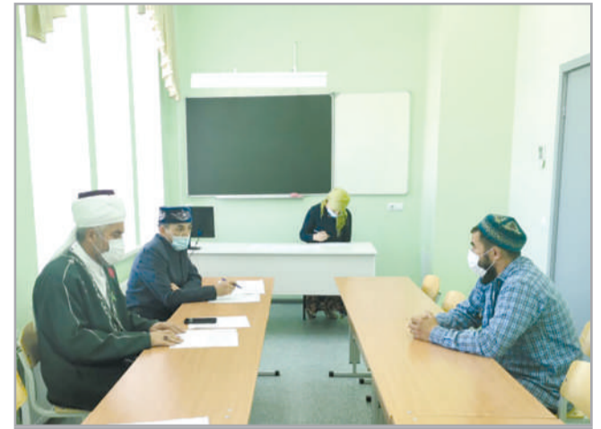
Прием абитуриентов на новый учебный год в медресе «Расулия»