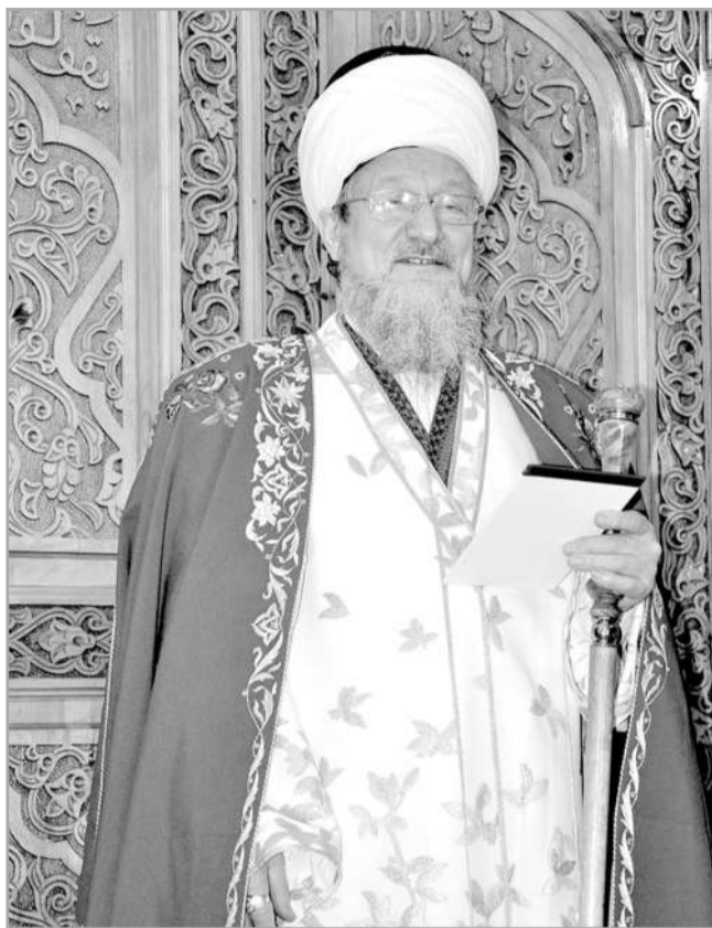
Ахыры. Башы 3-8-нче номерда 2020