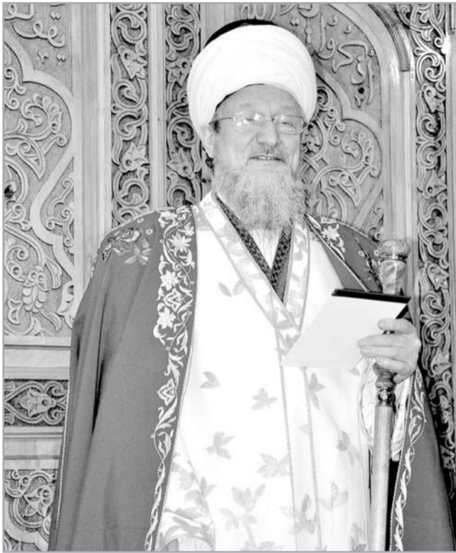
Ахыры. Башы 12-нче номерда 2020, 1, 2-нче номерда 2021