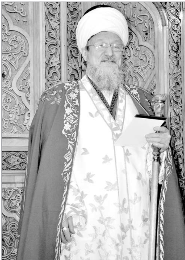
Ахыры. Башы 8, 9-нче номерда 2021