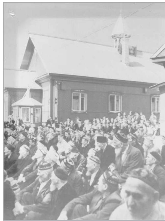
Праздник по случаю приезда в мечеть Верховного муфтия России Талгата ТАДЖУДДИНА

Например, 9-11 сентября 1980 года в Ташкенте проходила конференция мусульманских организаций СССР под девизом «XV век хиджры должен стать веком мира и дружбы между народами». В этой конференции принял участие староста мечети на хуторе Миасский города Челябинска