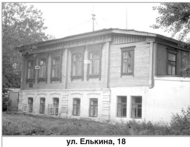
ул. Елькина, 18

Возвращения ждут также многие другие оставшиеся объекты исторического и культурного наследия Южного Урала. Инша-Аллах, здания, используемые в 20 веке не по назначению, вновь вернутся верующим.