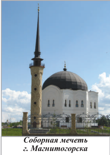
Соборная мечеть г. Магнитогорска

Сегодня Соборные мечети Магнитогорска и Челябинска стали центрами духовной жизни, очагами просвещения и религиозного образования. С каждым годом увеличивается число прихожан этих мечетей, в том числе детей и юношей. Расширяется круг благих дел и традиций, среди которых помощь одиноким и обездоленным стала неотъемлемой частью деятельности этих махаллей. Служение Всевышнему Аллаху и народу – вот главное, что заложено в миссию этих двух Соборных мечетей. И они несут свое предназначение честно и достойно.