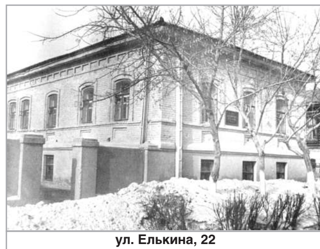
ул. Елькина, 22