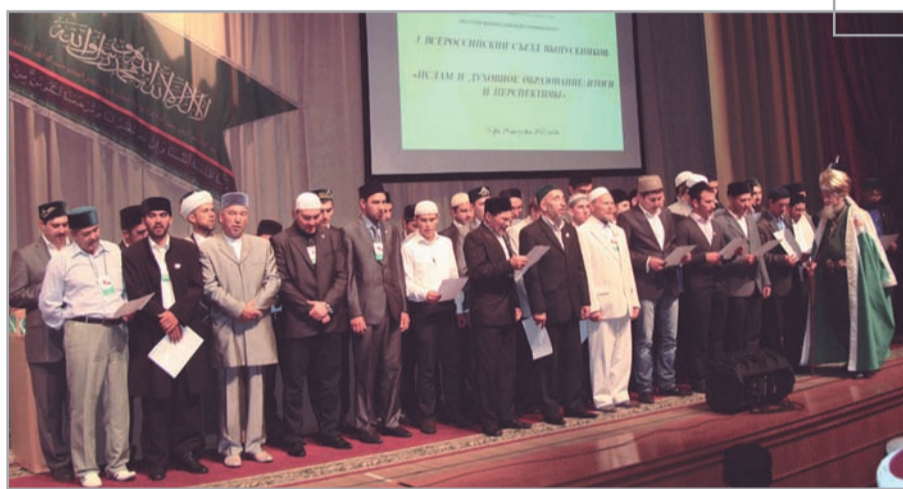
Напутствие выпускникам РИУ

Собравшиеся на форум делегаты вознесли молитвы Всевышнему Аллаху во имя процветания духовности, благонравия и благочестия в обществе и образованности, учености, как залога мудрости.