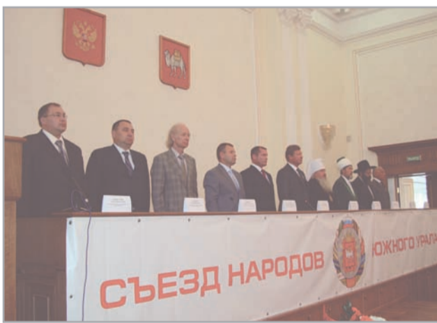
Торжественное открытие съезда

В работе съезда приняли участие около 300 человек. Это – представители городов, районов, руководители национально-культурных объединений, деятели культуры, духовенство, гости из других регионов.