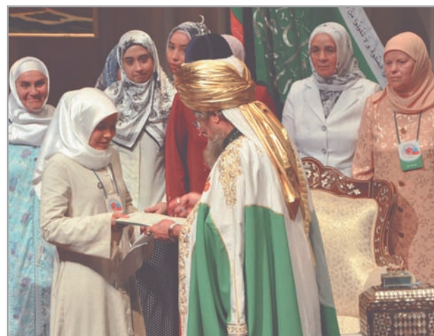
Вручение диплома Верховным муфтием России

По итогам работы I съезда выпускников Российского Исламского университета делегаты приняли Резолюцию, которая высоко оценила вклад ЦДУМ и РИУ в дело возрождения духовного образования и формирования в обществе духовности, основанной на идеалах и ценностях Ислама. Съезд обратился к органам управления и надзора в сфере образования РФ с убедительной просьбой не только контролировать сферу духовного образования, но и всемерно поддерживать ее, содейство-