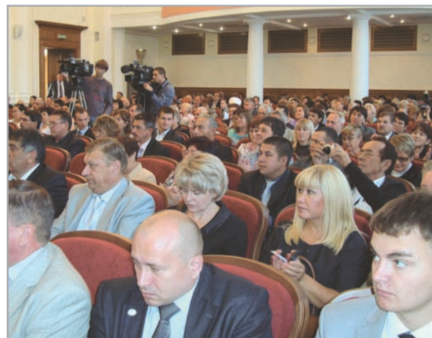
Делегаты съезда народов Южного Урала

Съезд народов Южного Урала будет проводиться ежегодно.