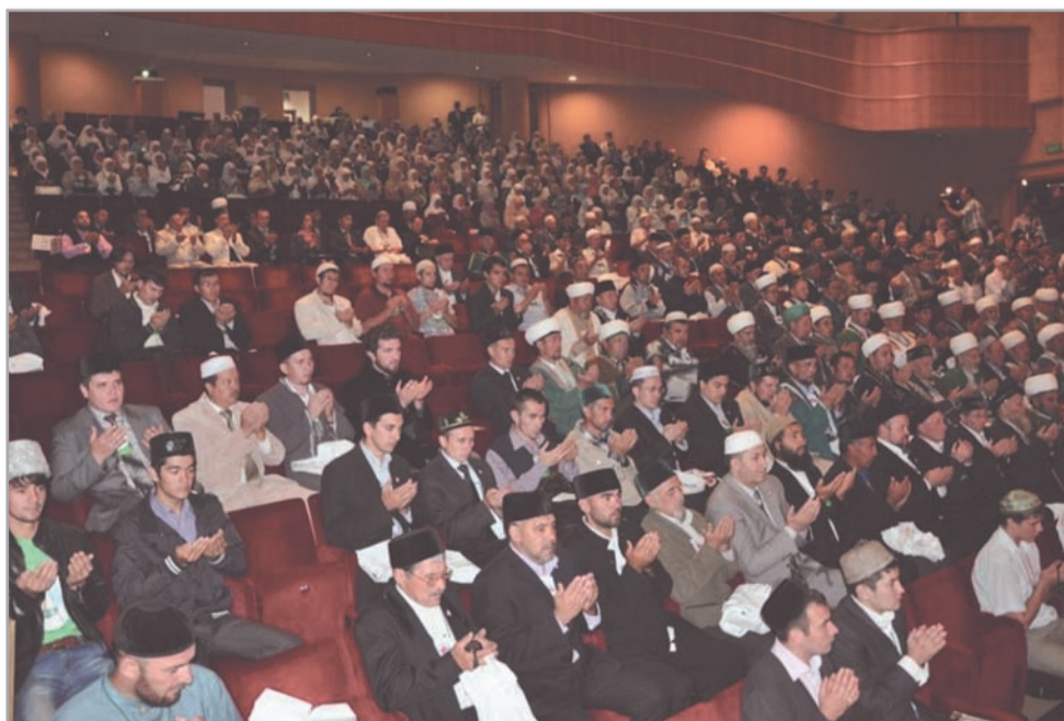
Выпускники РИУ и делегаты съезда

В прениях также участвовали преподаватели и руководители структурных подразделений РИУ, руководители и сотрудники медресе, учителя, преподаватели ВУЗов г. Уфы.