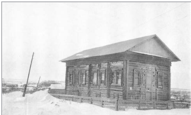
Давамы, башы 7-8-че номерда

Самара шәһәрәннән 20 чакрым кояш чыгышы ягында, ягъни Кинель якларына таба бер жирдә руслар һәм мөселманнар яшәгәннәр. Мөселманнар бу жирдән күчәргә мәжбүр булганнар. Мәсҗид Тупли авылына күчәрелгән. Руслар мөселманнарны Мача жирендә бик жәберләгәннәр дигән сүзләр дә йори. Мача белән Тупли арасында электән үк тыгыз элемтә булган диләр. Кардәшлек мөнәсәбәте һәм башкалар. Мача авылында ике мәчет булган. Берсен Туплига, икенчесен Филип авылына һибә кылганнар. Шул Мача авылыннан киткән мөселманнар Урал ягына Сибирягә барып урнашканнар. Бер адәмнең сөйләвенә караганда, Сибирядә Магнитогорск шәһәрәннән ерак түгел Мача дигән бер мөселман авылы бар икән. Ул авыл моннан (Самара яныннан киткән) шушы бабайларның авылы дип уйланыла. Анда барып чыккач та элек яшәгән авылның исеме белән Мача дип исем биргәннәр дип уйланыла. Шушы мәсҗидне Казан байларыннан Айтуганов дигән адәм бина кылдырган булган икән. Шул мәсҗид шәрифне Тупли авылына жигелгән 70 пар үгез белән зур арбаларга