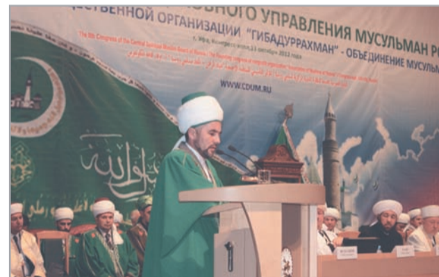
Выступление Главного муфтия Уральского региона, Председателя РДУМ Челябинской и Курганской областей Ринат-хаджи-хазрата РАЕВА

IX съезд ЦДУМ России решил многие организационные вопросы: избрание членов Президиума ЦДУМ, Ревизионной комиссии, принятие новой редакции Устава ЦДУМ, принятие итоговой Резолюции IX съезда ЦДУМ России.