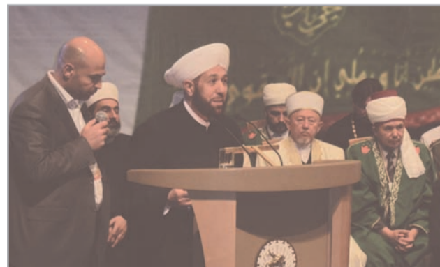
Выступление Верховного муфтия Сирийской арабской Республики Ахмада Бадруддина ХАССУН