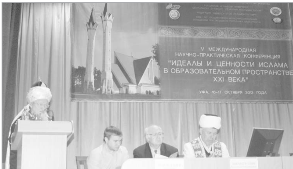
Выступление Верховного муфтия России Талгата ТАДЖУДИНА на международной конференции