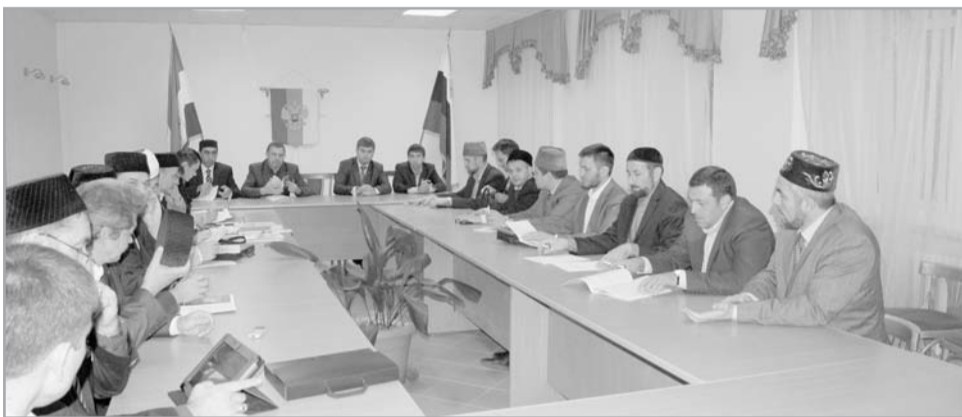
Заседание секции Совета по исламскому образованию

родной научной конференции состоялась работа круглых столов: «Молодежь и религия в XXI веке» и «Государственно-межконфессиональное отношение», а также прошла секция Совета по исламскому