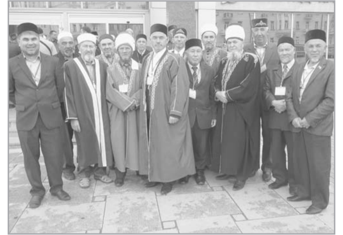
Делегация РДУМ Челябинской и Курганской областей на форуме в г. Казани

Закончились торжества коллективным полуден-