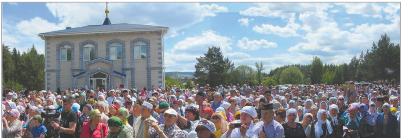
Тысячи верующих г. Златоуста приветствуют Верховного муфтия России Талгата ТАДЖУДДИНА