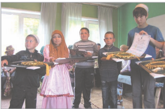
Команда-победитель из д. Учкулеево

Все команды были сильными, продемонстрировали хорошие знания. Дети хоть и стеснялись, но отвечали уверенно и полно. Но соревнования есть соревнования. И из 7-ми команд победили три. 1-е место заняла команда из д. Учкулеево, удивившая всех уровнем знаний и слаженностью в команде. Отвечали дети из Учкулеево очень грамотно, все сразу, хором. Они ответили на все вопросы. 2-е место жюри присудило детям из с. Сухоборское. Они не только хорошо отвечали на все вопросы, но и оделись в башкирские национальные костюмы, прочитали очень волнующие и красивые стихи об Исламе. 3-е место заняла команда из с. Таукаево. В конкурсе чтцов азана победил участник