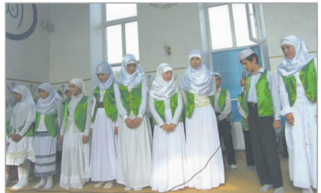
Команда Соборной мечети Металлургического района г. Челябинска

В этом году на Областной олимпиаде дети проявили очень хорошие знания. Отраднo, что уровень подготовки детей в мусульманских летних детских лагерях повысился. По итогам соревнований места распределились следующим образом: первое место заняла команда мальчиков мечети Исмагила (г. Челябинск), второе место – команда девочек Соборной мечети Металлургического района г. Челябинска, третье место - команда девочек