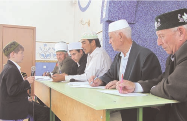
Конкурс-викторина на знание основ религии Ислам