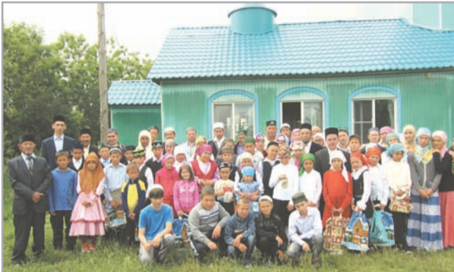
Участники районной олимпиады в Сафакулево

15 июня в мечети с. Сафакулево Курганской области прошла детская олимпиада Сафакулевского района. В олимпиаде участвовало 7 команд из д. Бакай, с. Сафакулево, с. Таукаево, с. Сухоборское, с. Мурзабаево, д. Учкулеево, д. Камышино. Соревнование проводилось в 3-х конкурсах: викторина (общие вопросы по религии Ислам); конкурс чтцов азана; конкурс на самую красивую мусульманку, критерием которого была закрытость одежды.