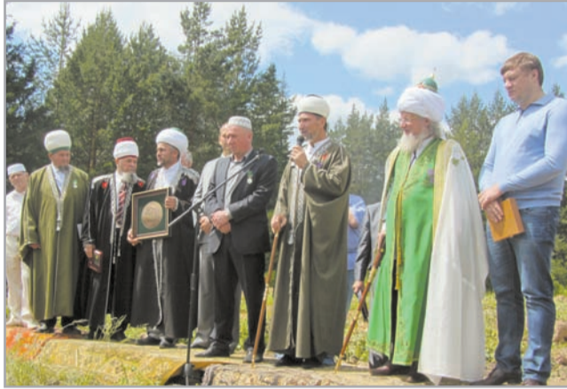
Торжественное открытие новой мечети в г. Златоусте

21 июня в г. Златоусте состоялось торжественное открытие нового 2-х этажного здания медресе, которое будет выполнять функции мечети, пока будет строиться основное здание мечети. Ее построили в течение одного года. Но несмотря на столь короткий период строительства, мечеть получилась столь прекрасной и современной, что у пришедших на торжество захватывало дух от ее великолепия. Два этажа, мраморные подоконники, разрисованные окна, прекрасная наружная и внутренняя отделка, дизайнерское оформление прилегающей территории с деревьями, цветами и фонтаном – все это теперь станет украшением города и гордостью мусульман.