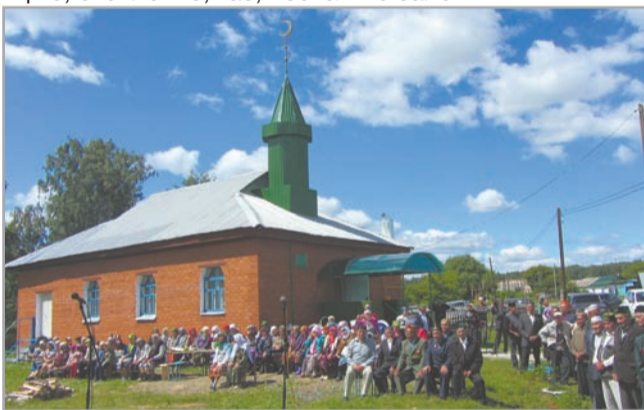
Жители д. Курманова собрались на праздник