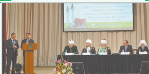
ИДЕАЛЫ И ЦЕННОСТИ ИСЛАМА В ОБРАЗОВАТЕЛЬНОМ ПРОСТРАНСТВЕ XXI ВЕКА»