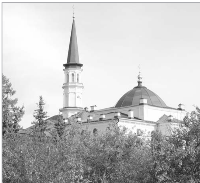
Первая Соборная мечеть г. Уфы - историческая резиденция Верховного муфтия России

Центральное духовное управление мусульман России является правопреемником Оренбургского магометанского духовного собрания, созданного в 1788 году по Указу императрицы Екатерины II. В истории ЦДУМ ярко отразилась история не только российских мусульман, но и всей страны. Менялись страницы истории - менялись и его официальные названия: с 1789 г. - «Уфимское духовное магометанское закона собрание» (с 1796 г. - Оренбургское); с 1846 г. - «Оренбургское магометанское духовное собрание» - ОМДС; с 1917 г. - «Духовное ведомство национального управления мусульман тюрко-татар Внутренней России и Сибири»; с 1923 г. - «Центральное духовное управление мусульман Внутренней России и Сибири»; с 1948 г. - «Духовное управление мусульман Европейской части СССР и Сибири» - ДУМЕС; с 1992 г. - «Центральное управление мусульман России и Европейских стран СНГ»; с 2001 г. - «Центральное управление мусульман России» - ЦДУМ России.