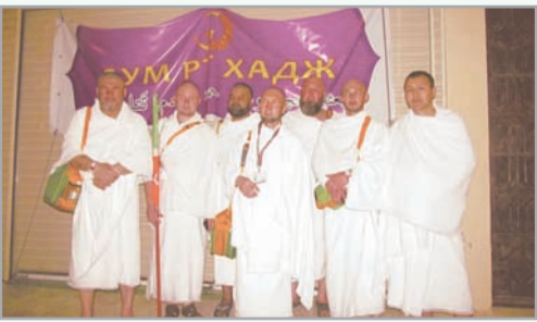
С ВОЗВРАЩЕНИЕМ, ПАЛОМНИКИ!