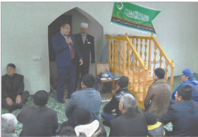
Праздничный намаз в мечети с. Тюбук Каслинского района

Как и мусульмане всего мира, верующие Южного Урала с волнением встретили этот великий праздник, завершающий обряд хаджа (паломничества). Не все имеют возможность совершить хадж, но те, кто остался дома, могут присоединиться к паломникам в богоугодных делах.