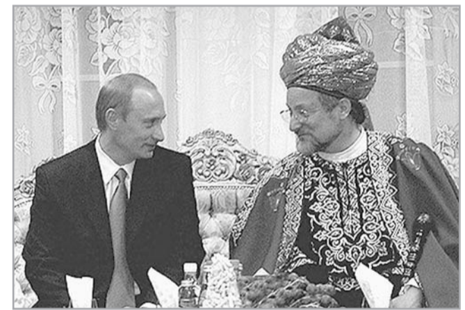
Встреча Президента РФ В. ПУТИНА и Председателя ЦДУМ России Т. ТАДЖУДИНА

Сегодня Центральное духовное управление му-