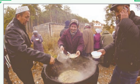
КУРБАН-БАЙРАМ Репортажи с праздника