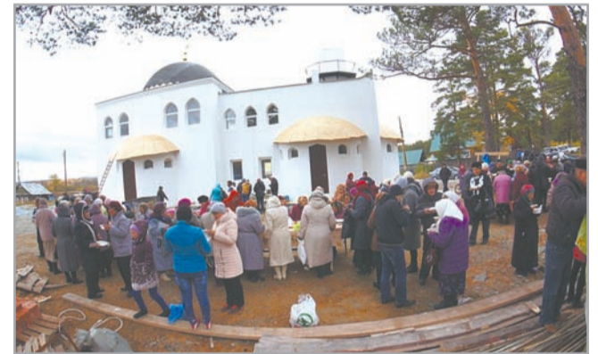
Курбан-Байрам в мечети г. Миасса

После праздничной молитвы и проповеди во дворе мечети были накрыты столы с угощением, прежде всего это блюда из баранины – суп-шурпа, были на столе и пироги, и фрукты. Для тех, кто не смог посетить праздничное мероприятие в Селянкино, были открыты двери в молельном доме по адресу ул. Романенко, 31, где также был проведен праздничный намаз.