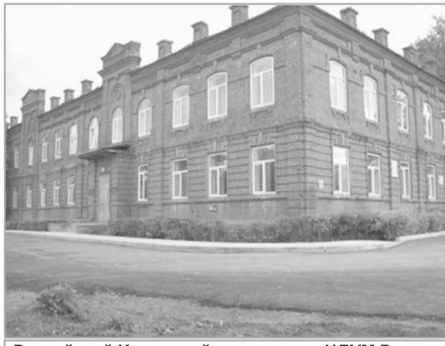
Российский Исламский университет ЦДУМ России (медресе «Галия»)

Созданное в январе 1989 года при ДУМЕС высшее медресе было первым после долгого периода атеизма учебным заведением, отвечающим современным требованиям развития высшего образования. Вскоре на базе медресе был создан Исламский институт, преобразованный в дальнейшем в Учреждение высшего профессионального образования «Российский исламский университет Центрального духовного управления мусульман России». Университет располагается в здании медресе «Галия», учрежденного еще в 1896 году. Российский исламский университет является преемником традиций высших исламских учебных заведений дореволюционной России. Здесь подготовлено более 1500 имам-хатыбов для мусульманских общин России и стран СНГ. В университете преподают высококвалифицированные специалисты по истории Ислама, чтению и толкованию Священного Корана и хадисов Пророка, по арабскому языку и литературе, мусульманскому