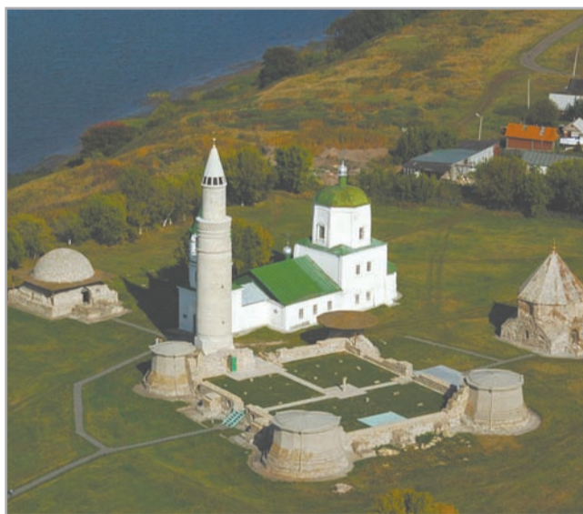
На земле Древнего Булгара

Принятие Ислама булгарами в качестве государственной религии сыграло исключительную роль в дальнейшем развитии наших предков. В 11 – 12 веках Волжскую Булгарию называют мусульманским государством известные ученые и путешественники: Бируни из Ср. Азии, Аль-Гарнати из Испании, арабский историк Аль-Балхи. В городах Булгар, Сувар, Биляр формируются крупные центры науки, которые распространяли воззрения известных арабских ученых и философов. С принятием Ислама прежняя руническая письменность заменяется арабской, закладываются основы булгарской письменности и культуры. Развивается научно-философская мысль. Стало увеличиваться число мечетей, а с ними и школ. В Булгарии появились талантливые ученые в разных областях науки, писатели, поэты. Широкое признание получили труды ученого Хаджихамета Аль-Булгари, философа Хамида бин Идриса Аль-Булгари, произведения поэтов Дауда Саксин – Суари, Кул Гали и др. Принятие Ислама помогло булгарской аристократии объединить разрозненные племена, укрепить мощь и государственность булгар, спо-