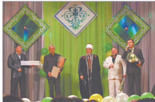
Главный казый УрФО Василь хаджи-акбар-хазрат МИНГАЗОВ поздравляет юбиляров

От имени Регионального духовного управления мусульман Челябинской области центр «Дуслык» поздравил Главный казый Уральского региона,