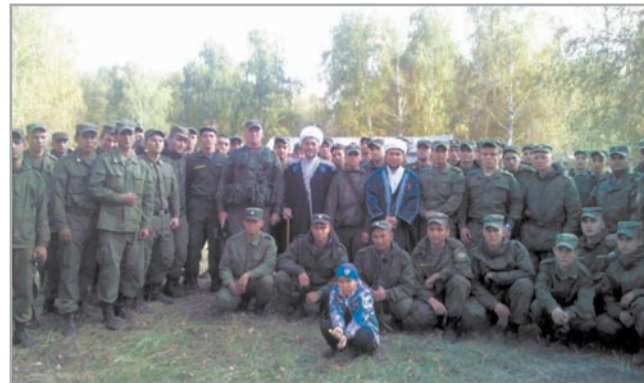
Духовенство РДУМ Челябинской области с личным составом на учениях

20-22 октября в Самаре состоялись сборы военного духовенства Центрального военного округа, на которых были подведены итоги деятельности помощни-