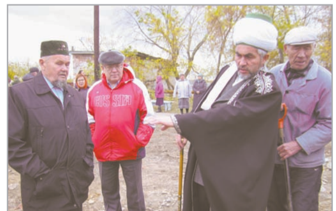
Глава Аргяшского района и муфтий Челябинской области на торжественной закладке первого камня

рится, ее строят всем миром. Региональное духовное управление мусульман Челябинской и Курганской областей также помогает в ходе строительства: оно консультирует по всем религиозным канонам, которые необходимо соблюдать при возведении мусульманского культового сооружения. Торжественное открытие мечети в Бажикаева планируется следующей осенью. А сегодня, несмотря на то, что мечети еще нет, верующие деревни продолжают собираться по домам, читать намазы. Организовано в Бажикаева и обучение основам религии Ислам, для этого по субботам в школе проводятся курсы. Инша-Аллах, через год мусульмане Бажикаева придут в новую мечеть для молитв и обучения.