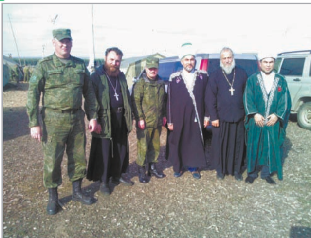
командование ВЧ и священнослужители на учениях «ЦЕНТР-2015»

Региональное духовное управление мусульман Челябинской и Курганской областей, исходя из данного решения, принимает самое активное участие в возрождении деятельности военного духовенства на Южном Урале и Зауралья.