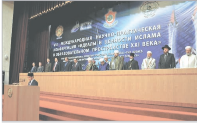
Конференция открылась чтением сур Священного Корана

«Где они были в 2003 году, когда, как коршун, Соединенные Штаты и более 40 стран напали на священную землю Ирака, бомбили Багдад? По сегодняшний день 70-100 человек каждый день умирают там. Где были эти богословы?» - задал муфтий риторический вопрос.