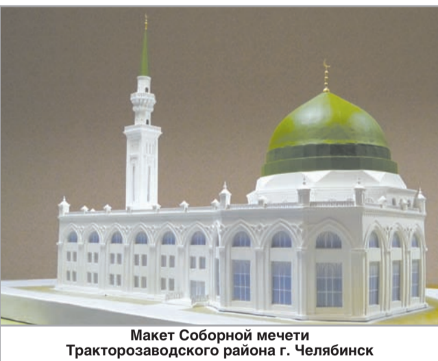
Макет Соборной мечети Тракторозаводского района г. Челябинска