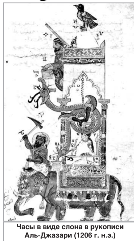
Часы в виде слона в рукописи Аль-Джазари (1206 г. н.э.)

Мусульманская астрономия, основанная на Священном Коране, на Шариате и многих науках – математике, геометрии, физике, химии, географии, философии, которые также активно развивались в исламском обществе, дала толчок развитию наук в Европе и других частях света. Во многом став первыми, мусульмане подали пример всему миру в сфере образования и науки.